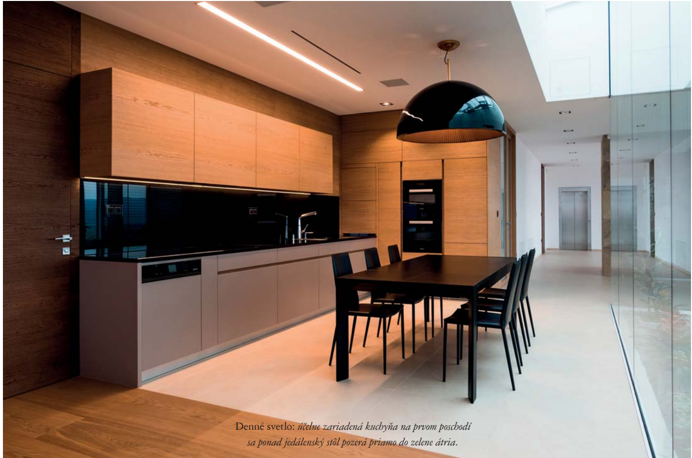
Denné svetlo: účelne zariadená kuchyňa na prvom poschodí sa ponad jedálny stôl pozerá priamo do zelenej ária.