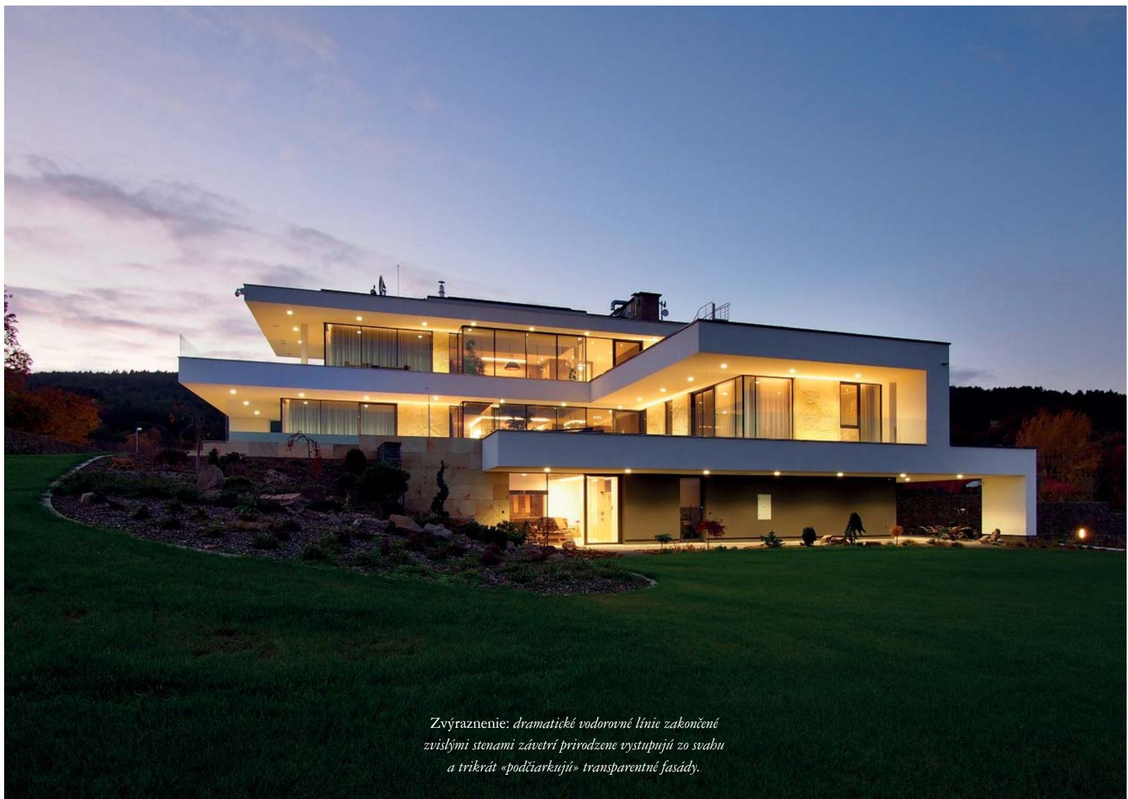
Zvýraznenie: dramatické vodorovné línie zakončené zvislými stenami závetrí prirodzene vystupujú zo svahu a trikrát «podčiarkujú» transparentné fasády.